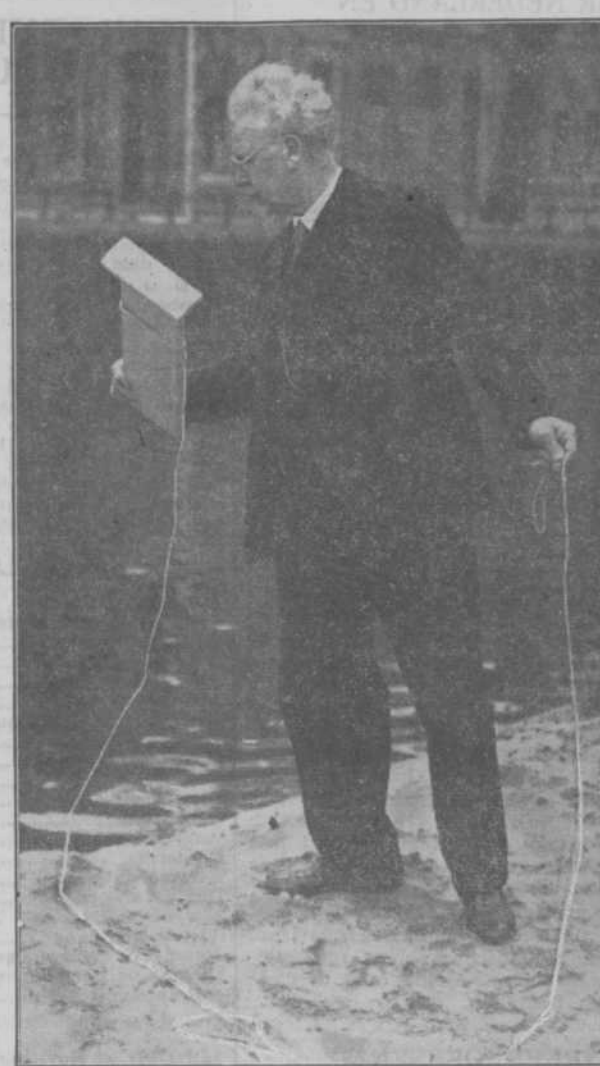
EEN MENSCHLIEVENDE HAARLEMMER heeft voorgesteld, dat allen die aan grachten wonen, aan hun gevel een witgeschilderd plankje met ongeveer 10 m stevig touw te bevestigen, dat als reddingslijn kan dienst doen.