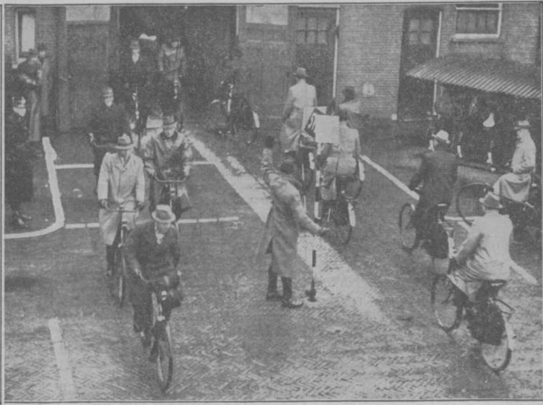
OOK PRACTISCHE OEFENINGEN behooren natuurlijk tot het opleidingsprogramma van de Haagse verkeersagenten; om beurten moeten zij het stopbord bedienen; de anderen fungeren dan als „verkeer” in straten, welke door witte lijnen worden voorgesteld.