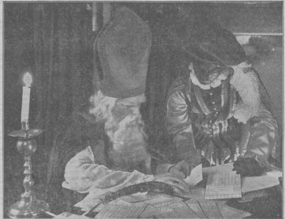
BIJ HET RONDDEELEN VAN HUN GULLE GAVEN moeten Sint-Nicolaas en Zwarte Piet, net als gewone stervelingen, natuurlijk ook terdege rekening houden met de distributiemaatregelen. Een persfoto graaf verraste gisteren het tweetal „ergens in Nederland”, terwijl zij een benidenswaardige hoeveelheid textielkaarten zaten te bewerken. Maar zij hebben ook een geweldige clientèle!