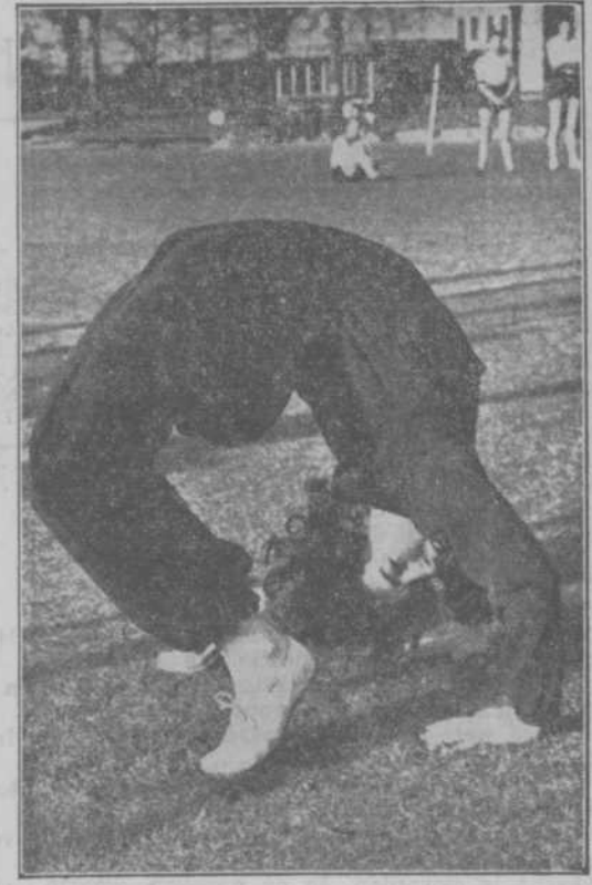
KUNT U DAT OOK? — Een goede oefening om lenig te blijven (of het te worden...) demonstreert dit Duitsche sportmeisje.