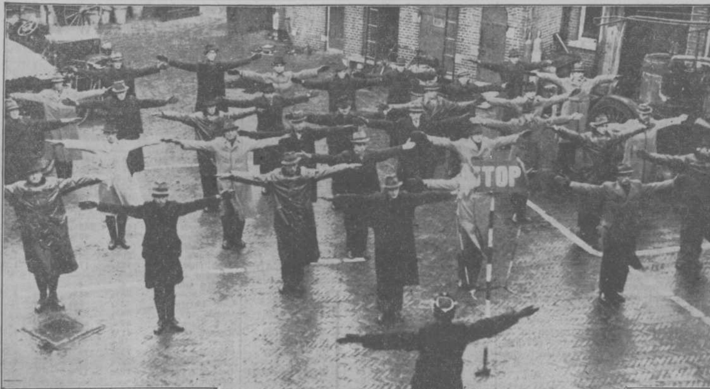
DE HAAGSCHE ASPIRANT-AGENTEN krijgen thans onderricht in verkeersregeling, waarbij de binnenplaats van de brandveerkerne aan de Duinstraat als oefenterrein dienst doet.